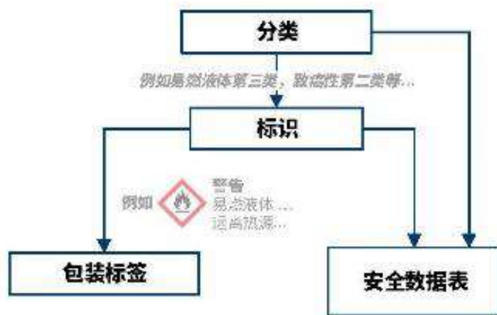
图 3.3: 根据 GHS 进行危害沟通

为了促进在全球化学品市场上的危害沟通交流，联合国制订了“全球化学品统一分类和标签制度” (GHS)。GHS 为应如何根据化学品的危害对其进行分类，以及该如何针对其危害进行沟通制订准则。物质与混合物的危害属性是通过分类确定的。根据分类结果，将确定需显示在包装标签上的必要的标签元素。分类信息和标签元素均被录入 SDS（图 3.3）。