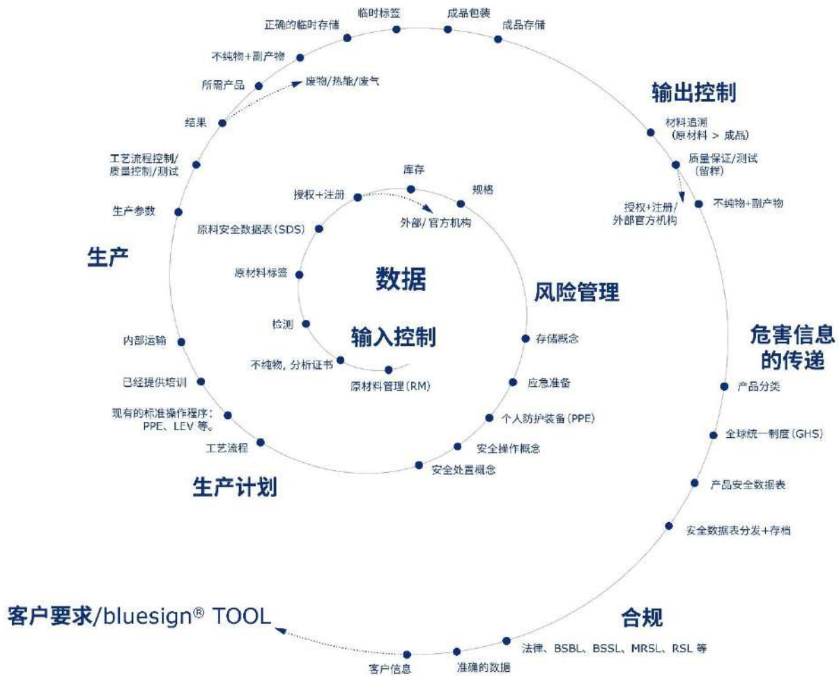
图 3.1: 化工行业的产品责任管理概览